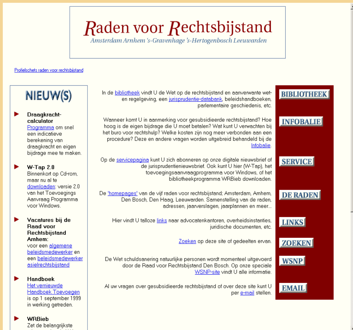
Figuur 4. De website van de gezamenlijke raden voor rechtsbijstand, 1999.

In december 1998 – bij de inwerkingtreding van de Wet Schuldsanering Natuurlijke Personen, waarvoor de Raad voor Rechtsbijstand 's-Hertogenbosch bestuurlijk verantwoordelijk was – werd een zusterwebsite geopend. 60 De daarop aanwezige WSNP-jurisprudentiedatabank was gebouwd volgens hetzelfde concept. Laatstgenoemde databank 61 wordt nog steeds onderhouden en bevat thans 1198 uitspraken. 62