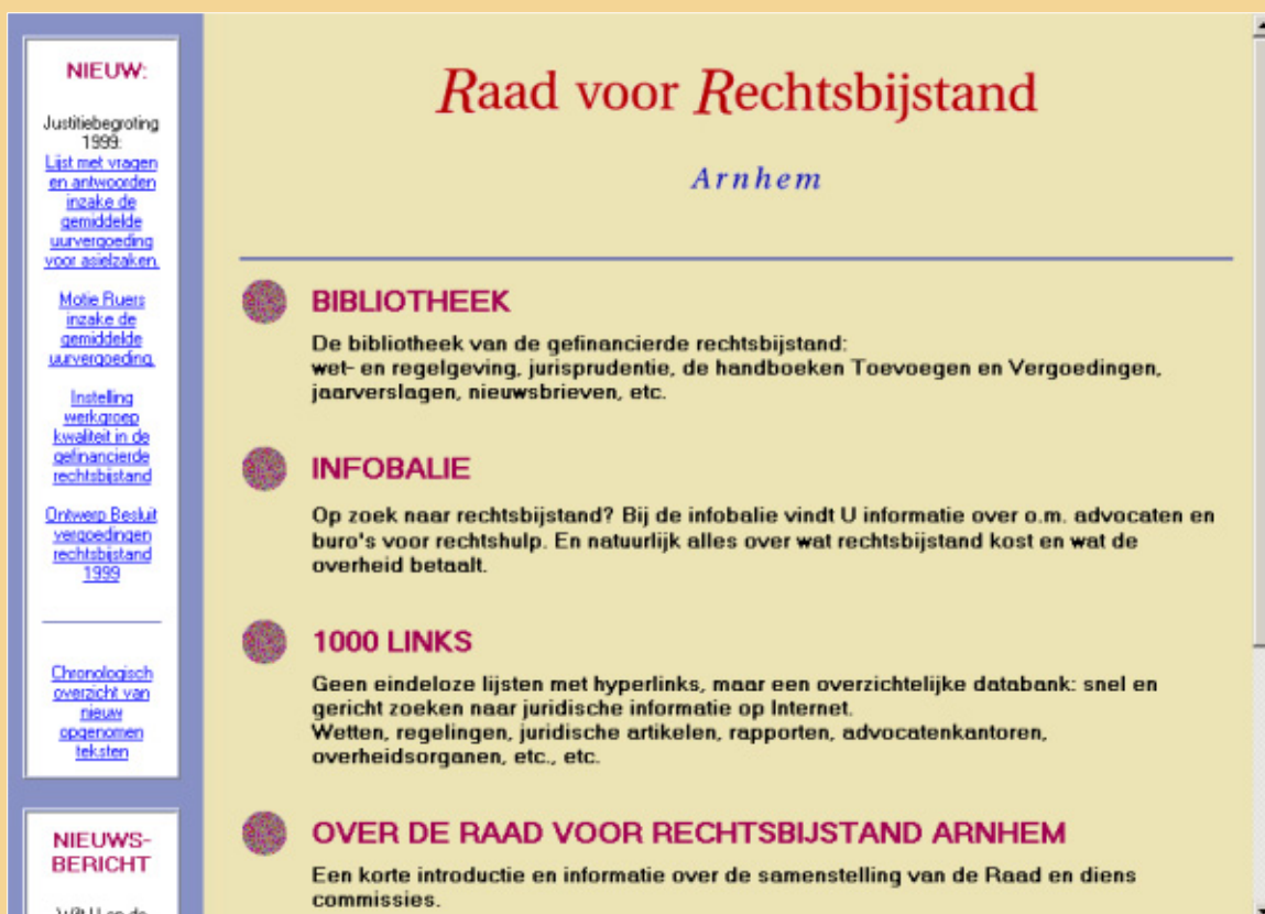
Figuur 1. De homepage van de Raad voor Rechtsbijstand Arnhem, begin 1999.

'Rechtsbijstandsrechtspraak' heeft over het algemeen alleen de interesse van het selecte gezelschap dat direct bij de overheidsgefinancierde rechtshulp betrokken is, zoals de sociale advocatuur en de medewerkers van de Raad voor Rechtsbijstand. 58 Buiten dit gezelschap kan de rechtsbijstandsrechtspraak eigenlijk alleen bij webarcheologen nog op enige bijzondere belangstelling rekenen: de eerste jurisprudentiedatabank op het Nederlandse internet was namelijk te vinden op de site van de Raad voor Rechtsbijstand Arnhem.